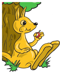
Pengambilan makanan dan snek sihat